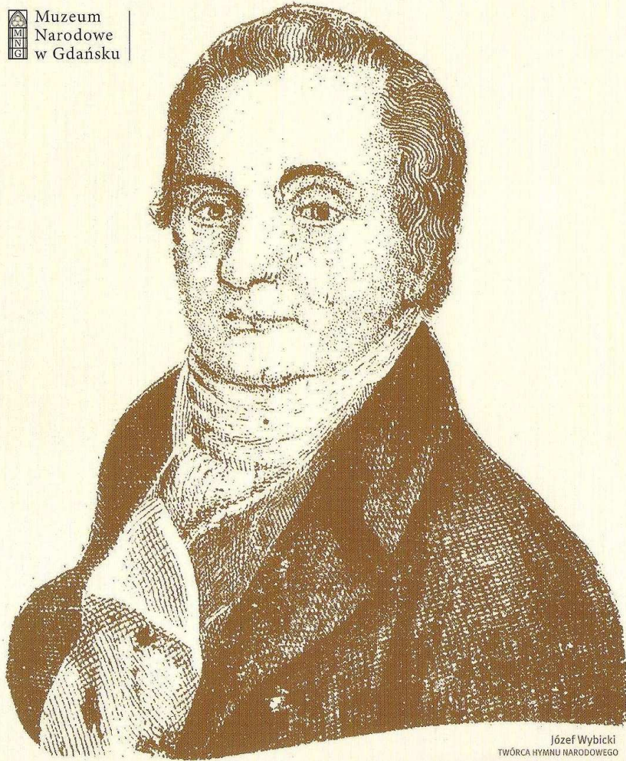
Józef Wybicki TWÓRCA HYMNU NARODOWEGO